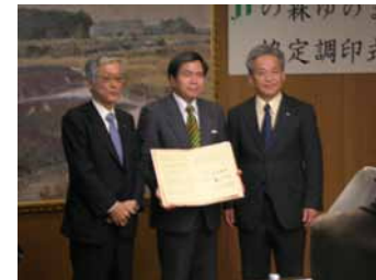
JTの森ゆのまえ 調印式