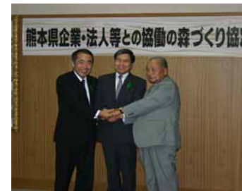
九電の森みさと 調印式