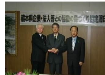
西部の森きくち 調印式